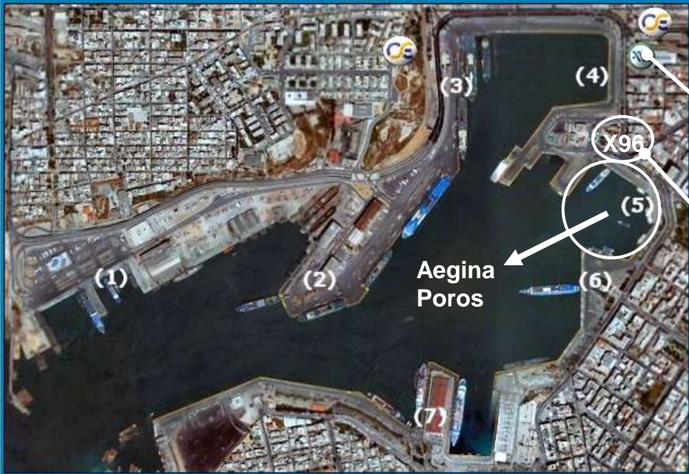
PORT OF PIRAEUS MAP

Lähes jokaisella laivayhtiöllä on oma lippukioski. Eivät yleensä tiedä mitään toistensa aikatauluista.